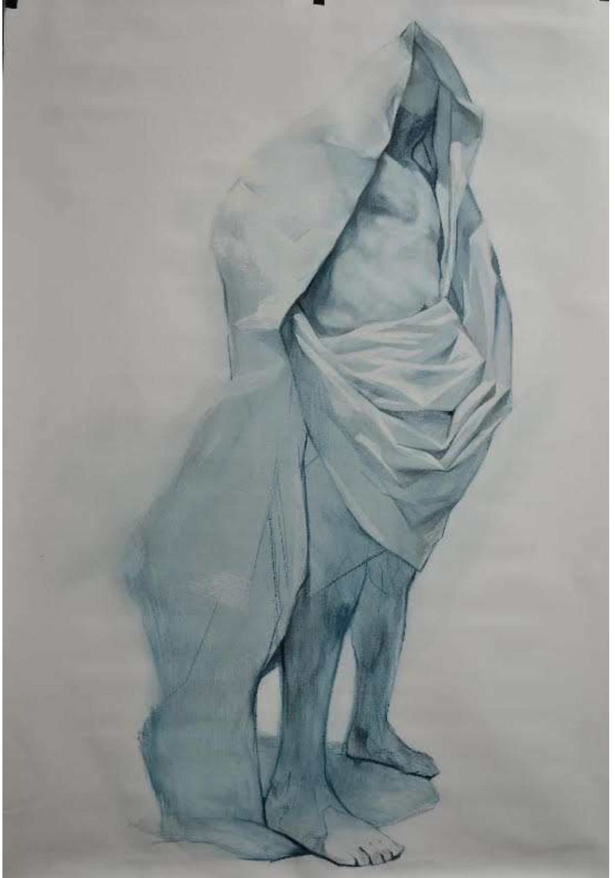
Schițe, creion de apă pe pânză, 75/105cm, 1000 eur