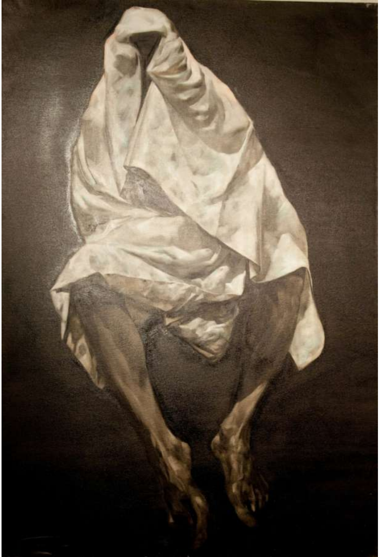
“The Messenger”, smoolă, calamină pe pânză, 105/140, 2900 eur