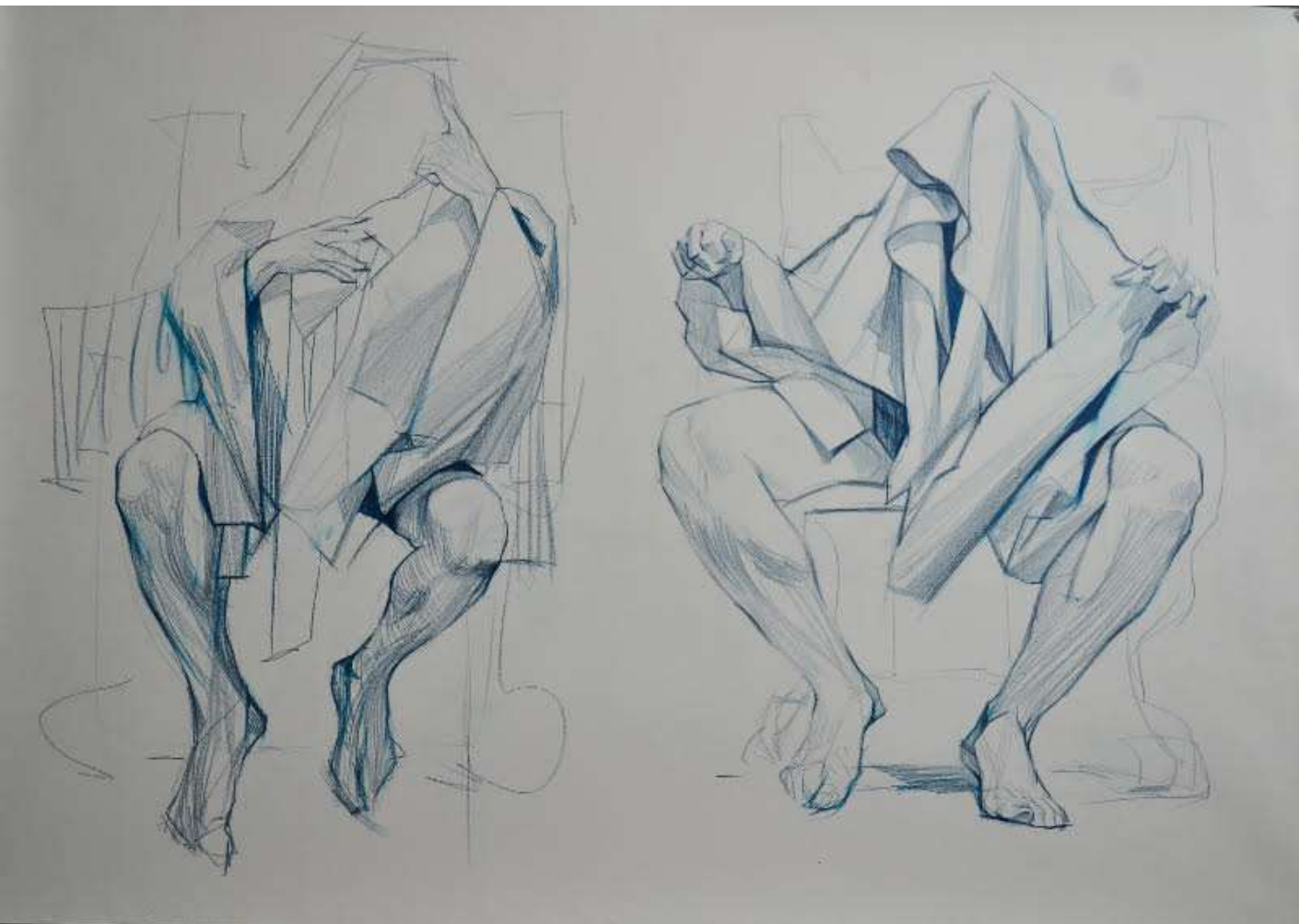
Schițe, creion de apă pe pânză, 95/105, 1000 eur