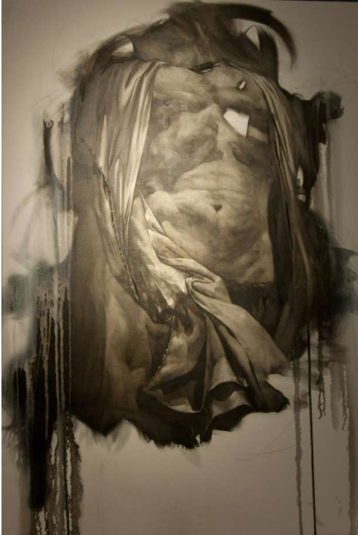
“Tarnished Heirloom”, smoolă și calamină pe pânză, 95/138, 2900 eur