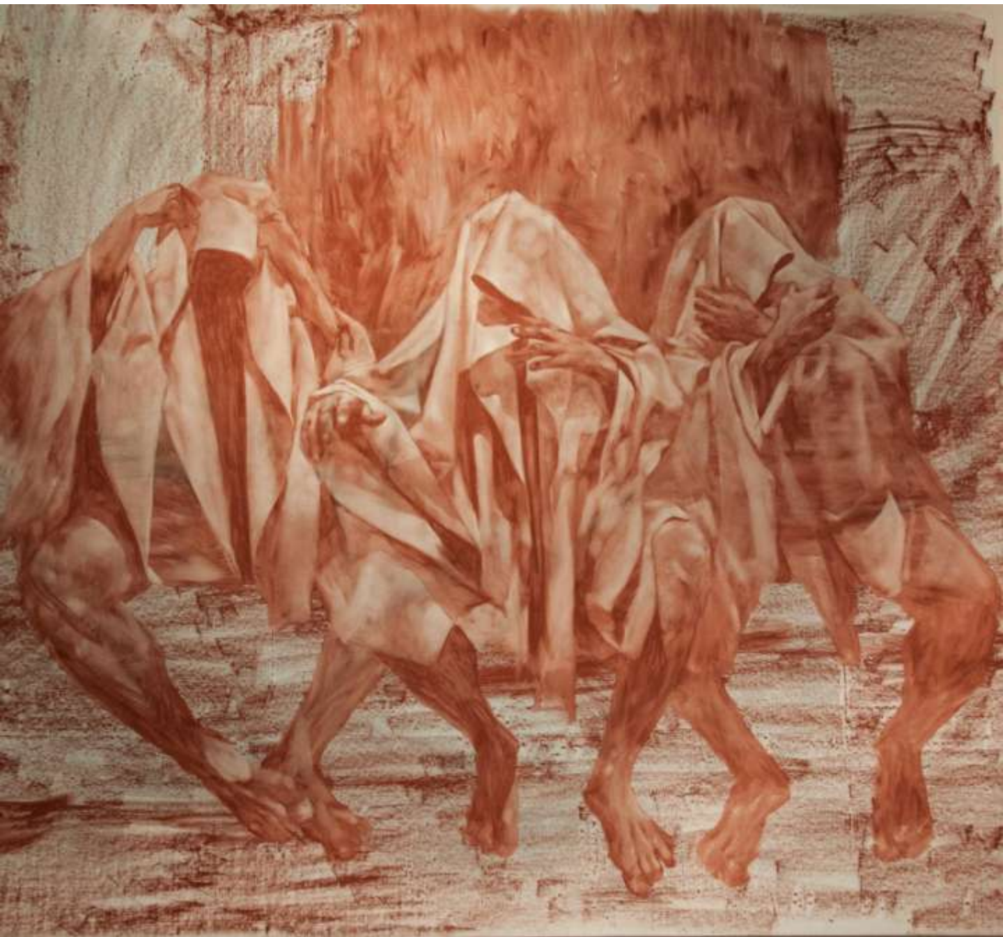
“Black Marketeers”, pastel uleios pe pânză 130/142cm, 3550 eur