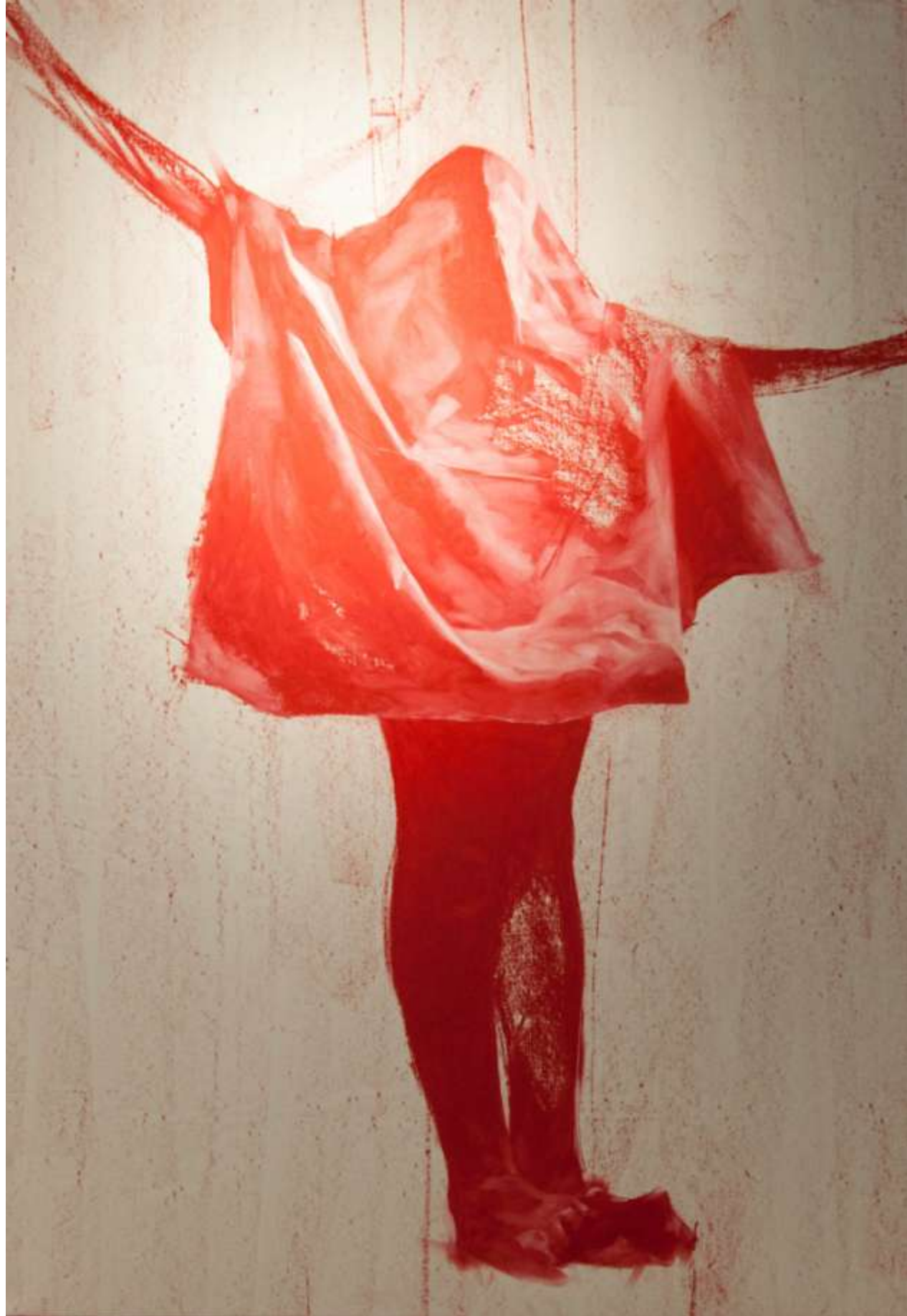
“Still Standing”, pastel uleios pe pânză, 95/105, 2900 eur