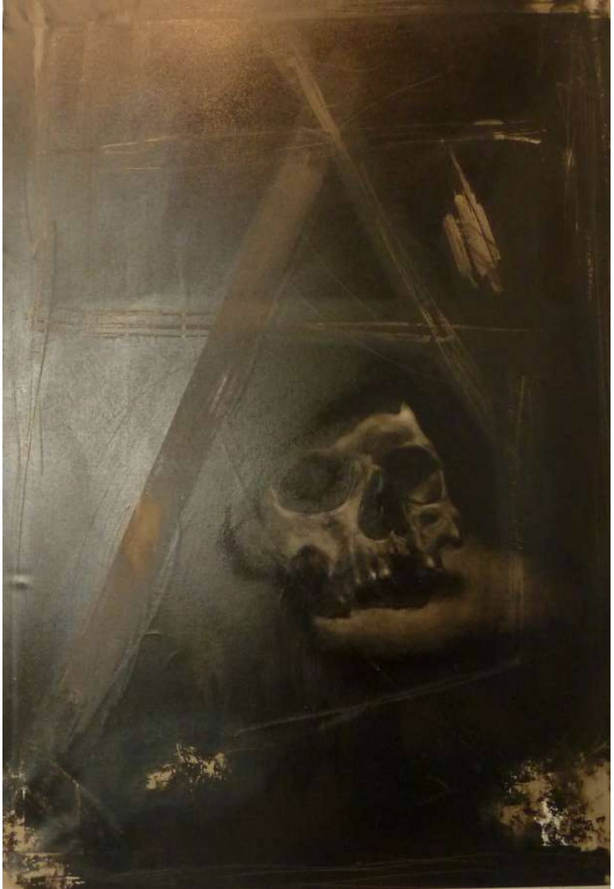
“Memento Mori,” smoolă, calamină pe pânză, 100 /70 cm, 2900 eur