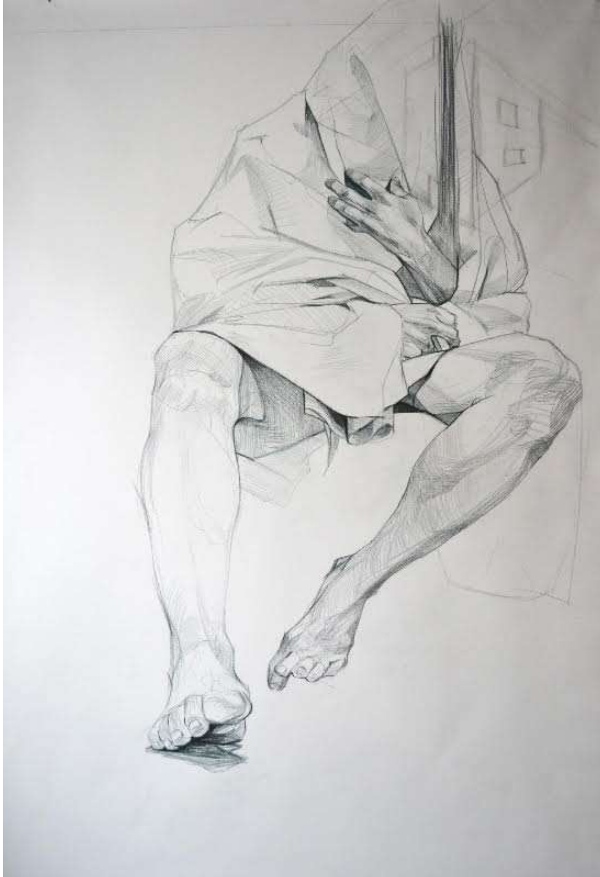
Schițe, creion de apă pe pânză, 75/105cm, 1000 eur