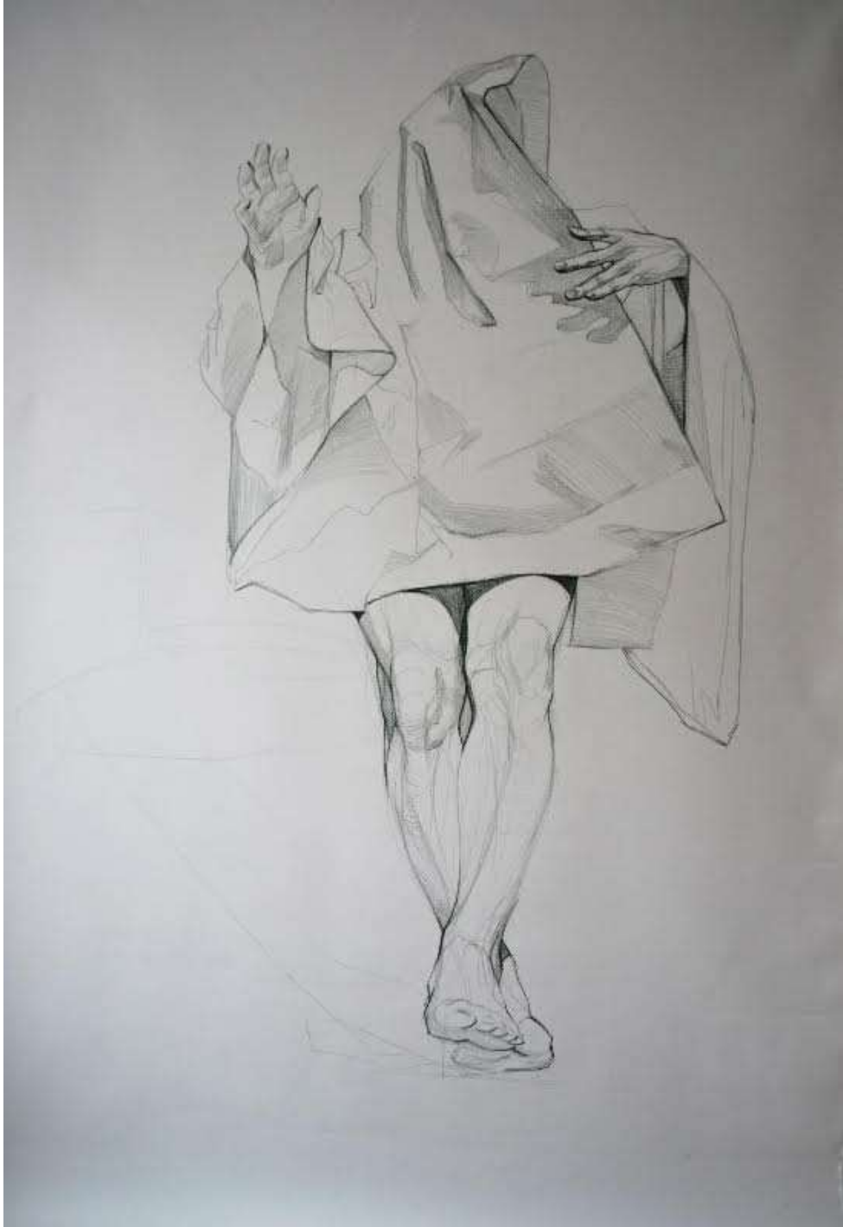
Schițe, creion de apă pe pânză, 95/105, 1000 eur