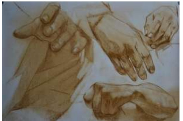
Schițe, creion de apă pe pânză, 50/70, 330 eur